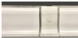
PHJ HYGIEN + Pièce de raccord

Solution de finition pour la liaison sols / murs Sa solidité grâce à son corps plein permet la protection des locaux tout en garantissant leur hygiène en facilitant le nettoyage. Lèvres souples pour une meilleure étanchéité Feuillure arrière pour épouser les U de sol.