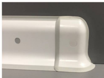
PHTDX-SX Embout plinthe