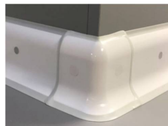
PH2E HYGIEN + Angle extérieur